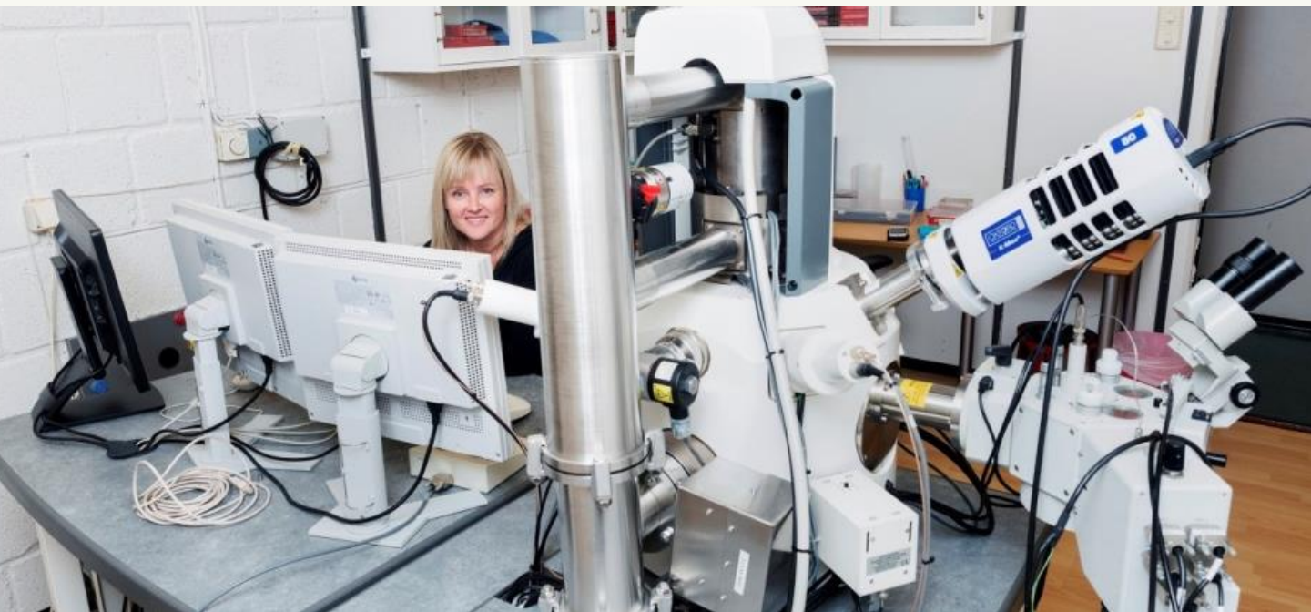
Imaging Centre, NMBU.

«Alle insektene i utstillingen er hentet fra mine nærmeste omgivelser; fra huset, hagen og skogen. Elektronmikroskopet som jeg bruker til å fotografere insektene kan forstørre over hundre tusen ganger. Insektene må gjennom en omfattende behandling og dekkes med metall for å tåle bombarderingen av elektroner fra mikroskopet. Elektronstrålen skanner insektets overflate og det dannes et bilde som gjør at insektet kan studeres og fotograferes på ekstremt nært hold. Siden insektet er dekket av metall kan elektronmikroskopet bare vise oss denne verdenen i svart hvitt. Jeg fargelegger derfor bildene for å fremheve insektenes fascinerende uttrykk og forunderlige detaljer».